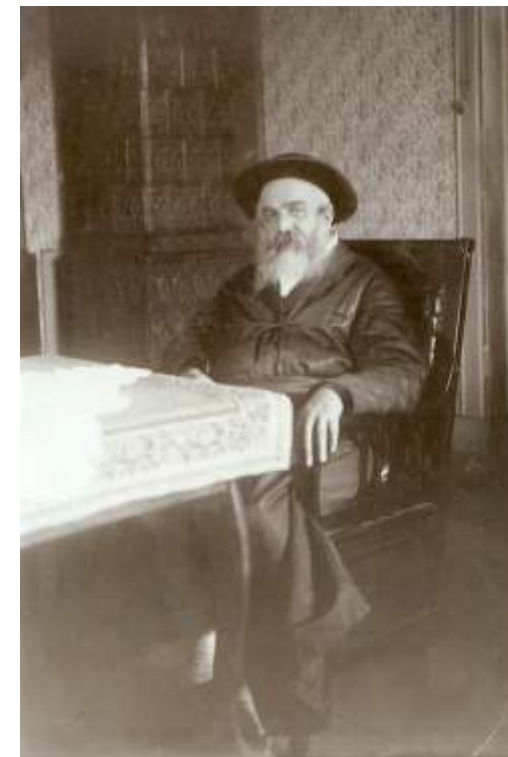
Chaim Elazar Spira Munkacser Rebbe Minchas Elazar 1868-1937

Simply go by sunset – no matter how long in between